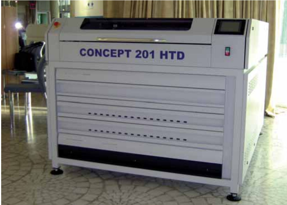
El Concept 201 HTD es una solución todo en uno para la reproducción de planchas con medidas de hasta 66 x 81 centímetros, ideal para etiquetas e impresión en banda estrecha, que integra el sistema de secado HDT.

La estrategia comercial de Degraf se basa en el suministro de soluciones únicas de alta tecnología a los principales fabricantes de equipamiento y a distribuidores independientes. Esta filosofía permite que la empresa cuente con una estructura más reducida y ágil que si tuviese que contar con su propia red de comercialización y soporte, permitiendo centrar todos los esfuerzos en el desarrollo y la fabricación de los equipamientos más avanzados del mercado.